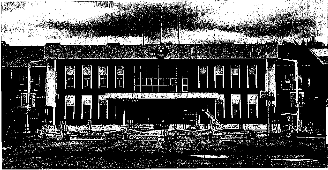
照片 2 國定古蹟空軍總司令部（原臺灣總督府工業研究所）