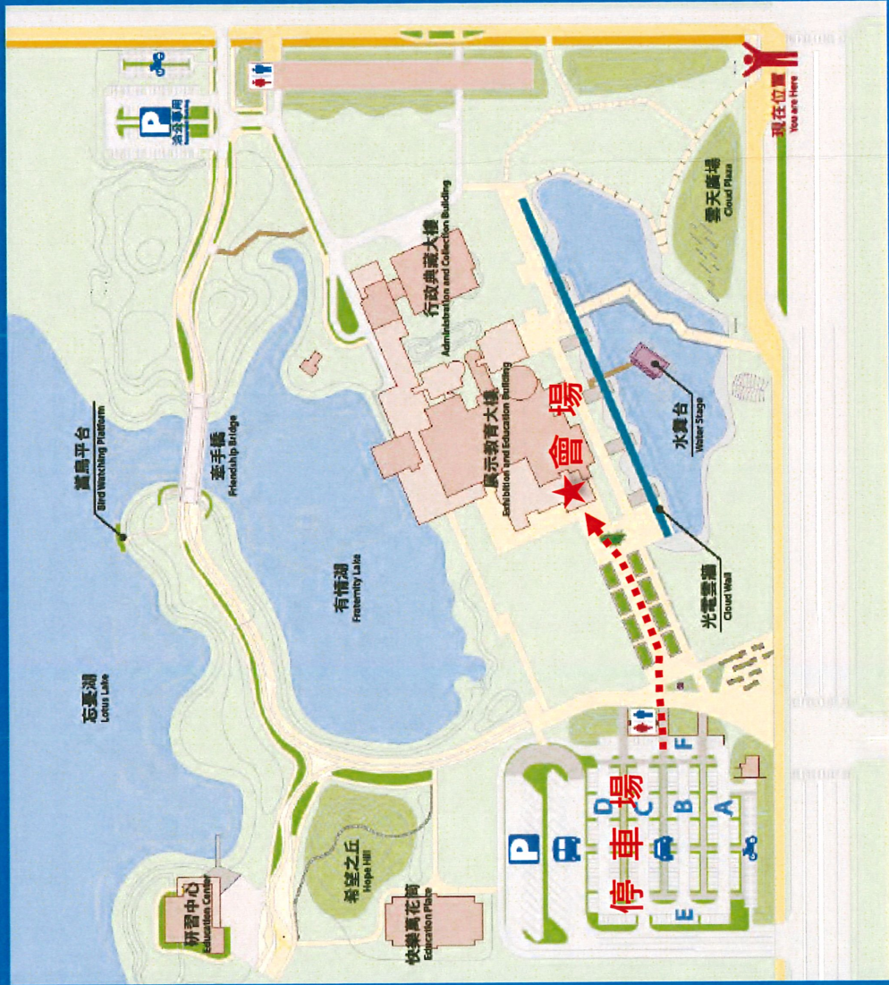
園區地圖 Museum Park Map